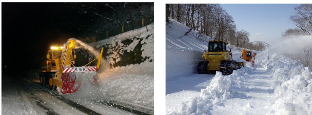
(一社) 秋田県建設業協会