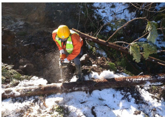
もんぜんまちふたまたがわ 輪島市門前町二又川地内（1月17日）