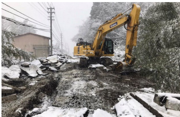
ほうすぐんのとちょうみやいぬ 鳳珠郡能登町宮犬地内（1月13日）