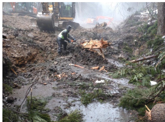
もんぜんまちふたまたがわ 輪島市門前町二又川地内（1月18日）