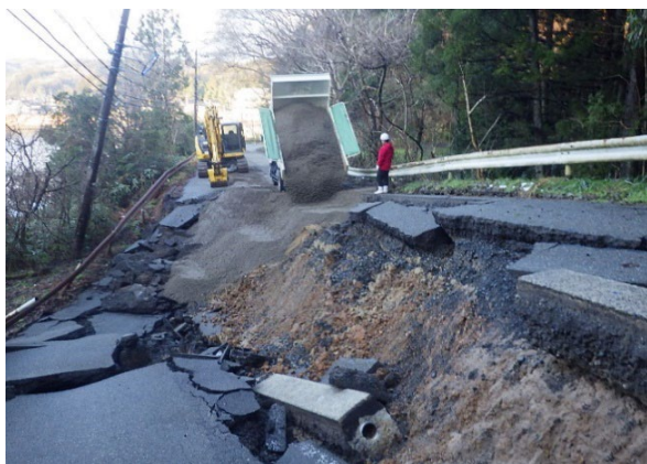
ほうすぐんあなみずましかわしり 鳳珠郡穴水町川尻地内（1月11日）